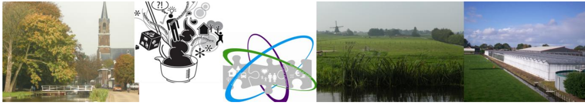
Fysieke ruimtelijke kwaliteit draagt bij aan de beleving van een gebied en daarmee de leefbaarheid en het nut van een plek.

Ideeën en wensen van gebruikers, of het nu vraag naar programma is of aanpassing aan de fysieke ruimte, zijn niet de enige ingrediënten voor een structuurvisie. Fysieke ruimtelijke kwaliteit is ook een belangrijk doel. Dat gaat verder dan mooi of lelijk, want over smaak valt niet te twisten. Professionele visie van planologen, stedenbouwkundigen, architecten en landschapsarchitecten is nodig om de fysieke ruimtelijke kwaliteit duurzaam te waarborgen en waar mogelijk vergroten.