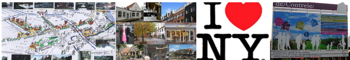
Visualisatie en inspiratie helpen het proces te verlevendigen en betrokkenheid te vergroten.

Met het gebieds-dna en de vraaganalyse als basis, kan voor elk (deel)gebied een doel worden gesteld. Welke ontwikkelingen dragen bij aan de versterking van een plek of het duurzaam verbeteren van de leefomgeving? De gebiedsdoelen (voor wijk, dorp, buurt of locatie) zijn heel geschikt voor profilering. Goed aansluitende, eerlijke branding kan betrokkenen en potentiële samenwerkingspartners inspireren en enthousiasmeren. Dan moet er wel meer zijn dan een lege reclamebus.