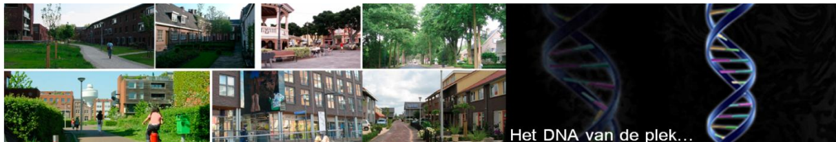
Wat maakt een plek anders dan andere en welke plek heeft welke functie of rol?

Elke plek is anders, zowel ruimtelijk-fysiek, als sociaal-cultureel, en heeft dus eigen kansen en beperkingen. Deze moeten worden benut waar mogelijk en zijn dus basis voor ontwikkelstrategieën. Wijk- of dorpsvisies zijn geschikte middelen voor de opbouw van een structuurvisie. Aansluitend op het DNA van een gebied of plek, kan een passende ontwikkelrichting en bijbehorend programma worden gezocht.